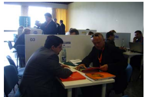
Empresas Workshop por Origen