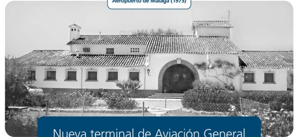
Aeropuerto de Málaga (1975)

Plaza Andalucía, 1 C.P. 29620 (Torremolinos - Málaga) ESPAÑA Tif (34) 952 382 888 www.marsans.es