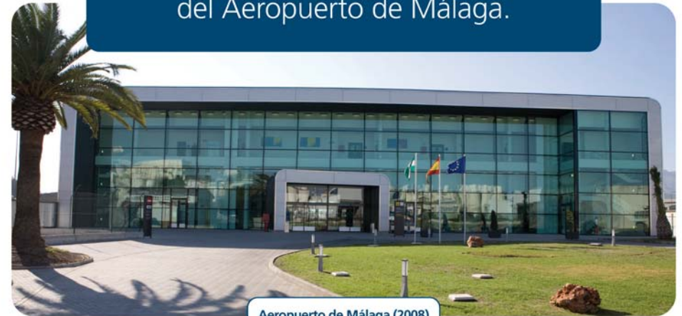
Aeropuerto de Málaga (2008)

El Aeropuerto de Málaga está llevando a cabo la mayor renovación de su historia. El Plan Málaga ya ha puesto en operación: