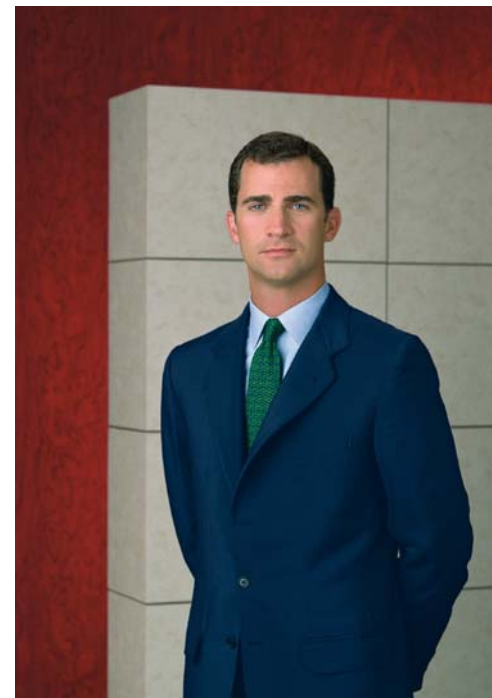
Su Alteza Real el Príncipe de Asturias Don Felipe de Borbón y Grecia