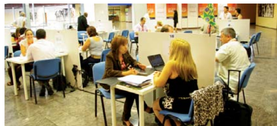
Conferencias, Presentaciones de Destinos Turísticos y Workshop.